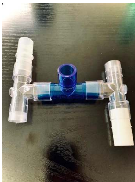
Figura 2: Cuatro pacientes / ventilador: 2 T + M / M / M